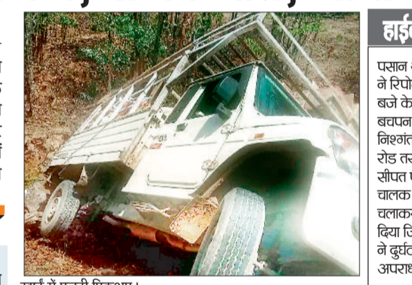
खाई में पलटी पिकअप।

एक पिकअप वाहन में लगभग एक दर्जन लोग सवार होकर साप्ताहिक बाजार के लिए जा रहे थे कि घाट में पिकअप वाहन चढ़ नहीं पाई और अनियंत्रित होकर लुढ़कते हुए पलट गई। इस हादसे में पिकअप वाहन में दबने से दो लोगों की