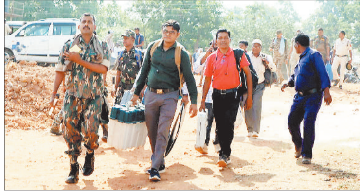
वोटिंग कराने रवाना होते मतदान दल के कर्मचारी।