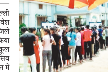
परीक्षा देने पहुंचे परीक्षार्थी।