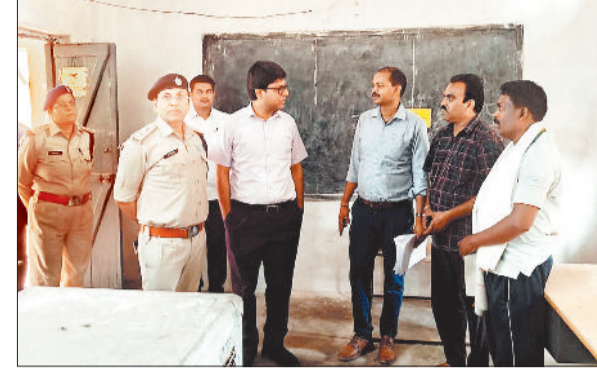
मतदान केंद्र का निरीक्षण करते कलेक्टर व एसपी।

सभी सहभागिता निभाते हुए मतदान अवश्य करें लोकतंत्र के महापर्व में 07 मई को रायगढ़ संसदीय क्षेत्र अंतर्गत जशपुर जिले के अंतर्गत विधानसभा जशपुर, कुनकुरी और पथलगांव के 6 लाख 71 हजार 846 मतदाता अपने मताधिकार का प्रयोग करेंगे। पुरुष 330282, महिला 341545, थर्ड जेंडर 19 मतदाता हैं। सर्विस मतदाता 1839 हैं। जिले में 878 मतदान केंद्र बनाए गए हैं। जशपुर विधानसभा 325, कुनकुरी विधानसभा 278, पथलगांव में 275 मतदान केंद्र हैं। प्रत्येक बूथ में 4 कर्मचारियों का दल है। इसके अलावा रिजर्व में भी मतदान दल हैं। जरूरत पड़ने पर उनका उपयोग किया जाएगा। सभी मतदान केंद्रों में पर्याप्त सुरक्षा की व्यवस्था की गई है। पेट्रोलिंग की टीम रहेगी। सुरक्षा के पर्याप्त इंतजाम किए गए हैं। गर्मी को ध्यान में रखते हुए मतदान कर्मियों के लिए पर्याप्त व्यवस्था की गई है। गर्मी को देखते हुए अधिकांश जगहों पर पर्तों का मंच श्रेष्ठ पेज 4 पर